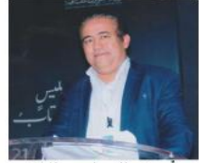
أجرى الحوار: طارق العمراوي