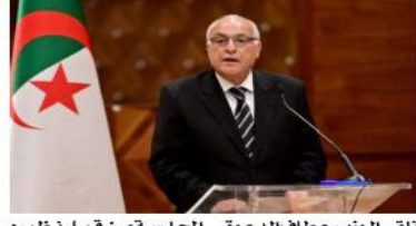
التقى الوزير عطاف الدعوة البرازيلي ماورو فييرا الذي للمشاركة في أشغال هذه الجلسة من قبل نظيره

شارك أمس وزير الشؤون الخارجية والجمالية الوطنية بالخارج السيد أحمد صطاف بنيتوي في جلسة رفيعة المستوى لمجلس الأمن لمناقشة التطورات الخطيرة التي تشهدها الأراضي الفلسطينية المحتلة وبما يخص قطاع غزة، في ظل تواصل العدوان الصهيوني الهجومي منذ السابع من أكتوبر، وقد