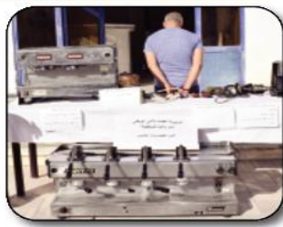
جميع الأمن الحضري الخامس بأمن ولاية قسنطينة في استرجاع أشياء مسروقة من محل تجاري، ووقوف المشتبه فيه.

مصالح الأمن الحضري الخامس بأمن ولاية قسنطينة لشكوى من قبيل مساحب محل تجاري مقادها تعرض محله لتسرقه بالكرس ابن استهداف الطاعل مجموعة من الآلات الختلفة (02) لعصر القهوة وكذا بعض العتاد الخاص بأعمال البناء والسباكة والترميم، مباشرة تم تكثيف الأبحاث والتحريات مع فتح تحقيق لمهرفة ملايسات القضية.