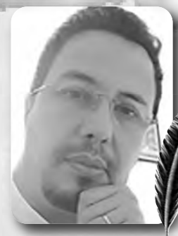
بقلم : حسان زهار