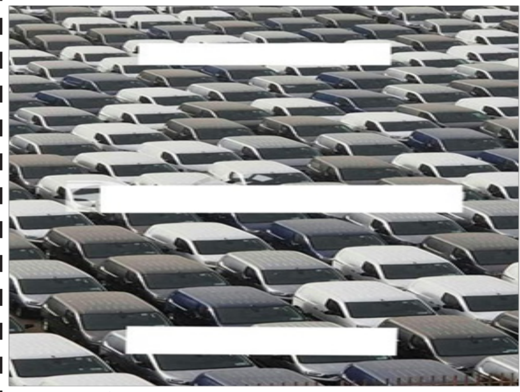
سيارات فيات من نوع دوبلو بميناء مستغانم