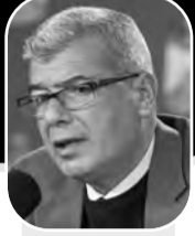
يقلم: عيسى قراقع

المشاهد المروعة في الحرب الدموية على قطاع غزة، والتي يرتكها جيش الاحتلال الصهيوني أصبحت تمثل قمة الانحطاط الإنساني والقيمي والأخلاقي والحضاري في العصر الحديث، سقوط منظومة قيم القانون الدولي والقانون الدولي الإنساني، سقوط القيم السماوية والأرضية معاً، تفجيرها بوحشية وعلناً وبوقاحة غير مسبوقة، انه عصر البدائية المتوحشة، العصر الأمريكي والأوروبي، عصر القذارة والفساد، وسلب الإنسان من قيمته وتحويله إلى مجرد شئ، إلى جثة وفق المفاهيم الاستعمارية المادية التي تنتج الموت والالة الحربية الذكية على حساب الطبيعة والعدالة الإنسانية والالهية. حتى ممر آمن ومساعدات إنسانية من الدواء والماء والغذاء والكهرباء ليس مسموحاً بها، المسموح الوحيد هو استمرار حمم الموت والحصار، دفن الناس وتزريق غزة سكاناً وجغرافياً وتحويلها إلى هيكل عظمي وبابسة مفروشة بالرمل الخروق والجمام، إنه عار تاريخي وإنساني، وعلينا كما قال الشاعر أدونيس أن نترحم على جنكيز خان وهولاكو وبقية الطغاة قبلهما وبعدهما، كانوا على وحشيتهم أكثر إنسانية، وأصدق من الطغاة الصهاينة في القرن الواحد والعشرين. هل هذا العدوان الذي يحصد أرواح البشر على مدار الساعة هو نهاية للتاريخ أم سقوط مدوي لما يسمى بعصر النهضة والديمقراطيات والعدالة والسلام وحقوق الإنسان؟ وعلى الفلاسفة