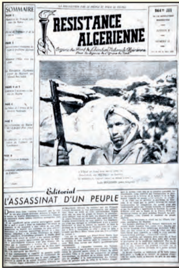
وكان لـ (المقاومة الجزائرية) ثلاث طبعات،

منذ انطلاق ملحمة نوفمبر 1954 أدرك قياديوها أهمية الإعلام كسلاح فعال في وجه المحتل الفرنسي، وتيقنوا من دوره في الدعاية والتعبئة والتوعية وتوير الرأي العام العالمي بعدالة هذه الثورة، ووسيلة للتعريف بأهدافها وغاياتها النبيلة وبشرعية الكفاح المسلح والنضال المتواصل الذي يخوضه الشعب الجزائري ضد الاحتلال الفرنسي لاسترجاع السيادة الوطنية التي افتتكت منه منذ أكثر من 130 سنة)، وتكذيب مزاعم الغزاة بأن (الجزائر جزء من فرنسا)!