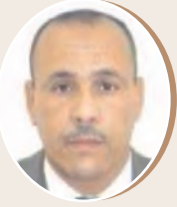
بقلم: فوزي مسمودي