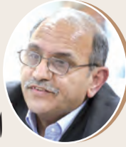
بقلم: هاني المصري