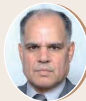
بقلم: إبراهيم أبراش