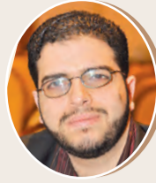
بقلم: زياد ابجيب