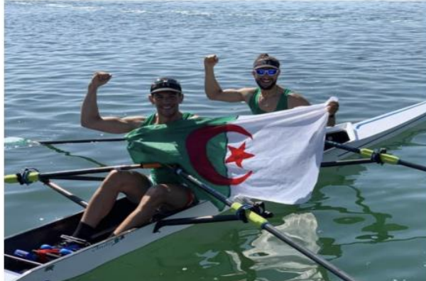
الدولة المستضيفة، و تحسبا للمشاركة في هذا الموعد الإفريقي، بني هارون بولاية بسد

يشارك المنتخب الوطني للتجديف في البطولة الإفريقية (رجال وسيدات) المؤهلة للألعاب الأولمبية باريس 2024، المزمع إقامتها من 23 إلى 26 أكتوبر الجاري بتونس، بـ 14 جادا وجدافة، حسب ما أفادت الإتحادية الجزائرية للعبة.