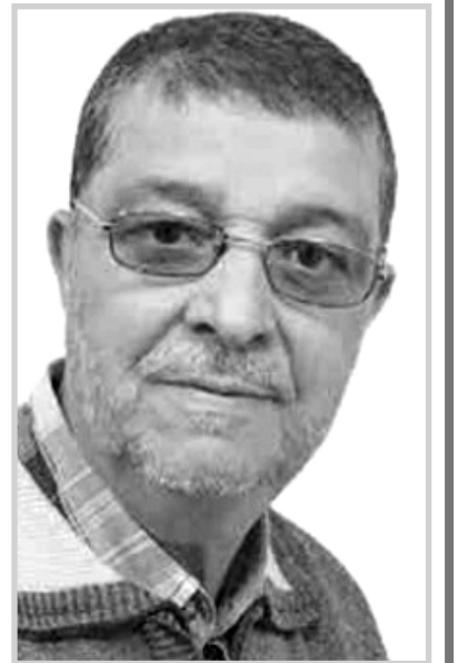
بقلم قرار المسعود

فهو حسب. أصبح واضحا من خلال الرسالة المفتوحة الموجهة من شعوب و مجتمعات العالم قاطبة بمختلف اديانها و انتماءاتها و ظهور قوى الشر و الغطرسة في المعمورة على إثر العدوان في غزة بفلسطين أن الظلم و الكراهية و الغطرسة لم و لن يعد لهما وجود حاليا و مرفوض كليا و بأي شكل من الأشكال و يحل محلها السلم و الأمان على مستوى كل الكرة الأرضية ولا يمكن أن يمتلكها أحد بمفرده ليفسد فيها . و قد اقتنع العالم اليوم بالحقيقة عبر ما يشاهده ما الذي كان مخفي عليه و مضلل و ظهر له سلوك و تصرفات الصهيونية الماسونية مقارنة مع الطبيعة البشرية و ما تطبقه على المجتمعات و الشعوب. طالما حذر الإسلام من هذه الفئة و أكد بانها سبب كل فتنه و بلاء في الكون و شتتها الله و غضب عليها نتيجة أعمالها، و منذ تكون كيان في فلسطين لم تجد هذه المنطقة استقرارا و لا أمانا.