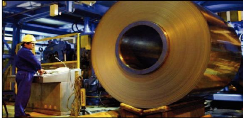
على قدرة البلاد التنافسية كمركز اقتصادي.

وارتفع عدد الشركات التي تعزم زيادة أسعارها في ألمانيا لأول مرة منذ عام في سبتمبر، ما يشير إلى أن التضخم على ما يبدو سيظل متجاوزا هدف الـ 2 في المائة في الشهر المقبل، بحسب ما أظهره مسح أجراه معهد إيفو الاقتصادي الألماني. وقال المعهد «إنه فيما يخص الاقتصاد عموما، ارتفع مؤشر توقعات الأسعار إلى 15.8 نقطة في سبتمبر من 14.7 نقطة في أغسطس، لينتهي سلسلة تراجع استمرت 12 شهرا على التوالي».