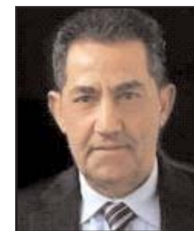
بِقلم: عبد الحميد صيام

حل الإنكليز في بلداننا تعليمنا الحضارة في فلسطين والعراق ومصر واليمن الجنوبي، يا سلام على تلك الأيام، كان الإنكليز يتلذذون في قتل الناس واصطيادهم، وكانوا يتراهنون على من هو أوفر في الرماية باختيار شخص بعيد وإطلاق النار عليه. مقابريهم بعد ثورة العشرين في العراق شاهد على التجربة. في فلسطين زرعوا الكيان وعينوا مندوبا ساميا صهيونيا ليسهل الهجرة وتنفيذ وعد بلفور. سهلوا له امتلاك الأراضي والسلاح والتدريب وضموا فرقة منهم في الجيش أثناء الحرب العالمية الثانية ليكونوا جاهزين، وعندما حل الرحيل ليكونوا أكثر جاهزية لإعلان ما سموه زورا وبيهتانا «الاستقلال» وكان بريطانيا كانت تستعمرهم هم وليس فلسطين العربية. أما