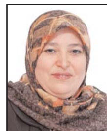
بِقلم: الدكتورة سميرة بيّتام

هو صوتي أنك فلسطيني، تركن عيناى حزينة عليك، فلا تزيد بحزنك على حزني، فلم يبق الكثير وأراك منارة فوق كل الظنون وكل النيات.