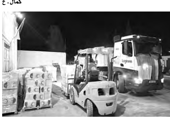
على حشد المساعدات الإنسانية اللازمة لمساعدة الشعب الفلسطيني وسكان قطاع غزة، من بينها من عملت حملات تطوعية قبل فتح معبر رفح لترميم المساعدات.

قررت الجزائر، بأمر من رئيس الجمهورية، السيد عبد المجيد تبون، إرسال مساعدات إنسانية هامة واستعجالية، إلى قطاع غزة عبر معبر رفح عن طريق جسر جوي مكون من العديد من الطائرات التابعة للقوات الجوية للجيش الوطني الشعبي، حسبما أفاد به أمسي بيان لرئاسة الجمهورية.