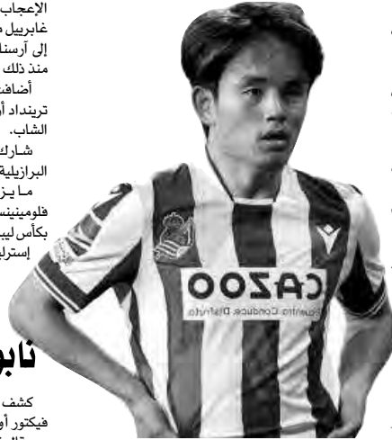
غوارديولا يخذل هالاند

ولدى ريال مدريد بند يمكنه حق التعاقد مع اللاعب، مقابل 30 مليون يورو فقط، أي نصف قيمة الشرط الجزائي في عقده. نجح تاكيفوسا كويو في إحراز 5 أهداف وتقديم تمريرتين حاسمتين في مختلف البطولات، هذا الموسم، ما جعل قيمته التسويقية تصل إلى 50 مليون يورو. ورغم قرار ريال مدريد باستعادة خدمات كويو، لكنه ليس واضحا حتى الآن، إذا كان سيستمر ضمن صفوف "الميرينغي"، أم سيقرر النادي الملكي إعادة بيعه بسعر أكبر، مستغلا التألق الكبير له هذا الموسم. وتذكرت الشبكة الإسبانية، أنّ في حالة بقاء كويو مع ريال مدريد في الموسم المقبل، سيكون خوسيلو، هو الاسم الأكثر تهديدا بالرحيل، رغم المستوى الجيد الذي يقدمه هذا الموسم مع "الميرينغي".