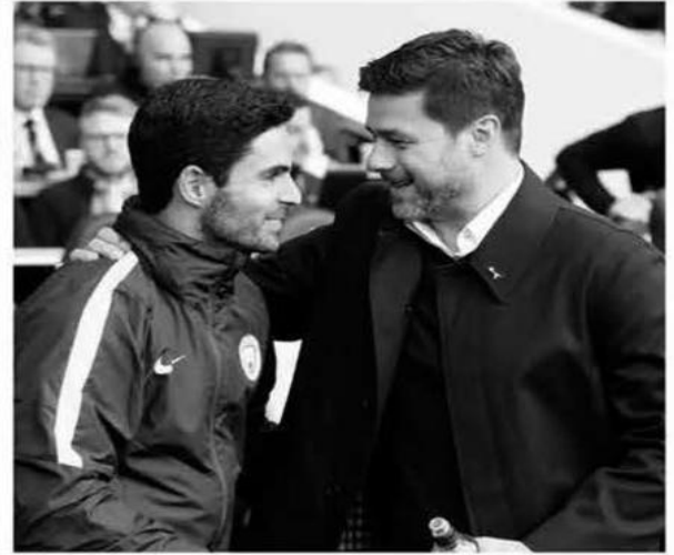
كشفت الإسباني ميكل أرتيتا مدرب أرسنال الإنجليزي أن "مثله الأعلى" ونظيره الأرجنتيني، ماوريسيو بوكيتينو، نصحه بعدم دخول معترك التدريب، وذلك عشية المواجهة المرتقبة بين تشلسي وأرسنال على ملعب ستامفورد بريدج، السبت، ضمن المرحلة

وتابع: "هو (بوكيتينو) أحد أكثر الأشخاص تأثيراً في مسيرتي الكروية، أولاً كلاعب عندما احتضنتني. فقد اهتم بي كطفل صغير، كشقيقه الأصغر، ولعب دوراً كبيراً في نجاحي في صفوف باريس، لأنه كان دائماً يهتم بي ويسدني النصائح، وسأبقى ممتناً له دائماً، لما قام به تجاهي". كما كشف أرتيتا أيضاً بأن بوكيتينو الذي سبق له تدريب توتنهام الإنجليزي وباريس سان جيرمان، نصحه بعدم دخول معترك التدريب، وقال ضاحكاً: "نصحتني بعدم دخول مجال التدريب، إنه أمر في غاية الصعوبة". وتابع: "كنت وانصبا بأنه سيصبح مدرباً، لقد تابعته عن كثب. عندما كان لاعباً كان قائداً فعلياً على أرضية الملعب، طريقته في فهم اللعبة كانت مذهلة. لقد كان دائماً يقوم بتدريبي".