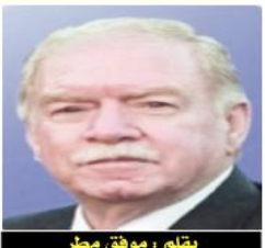
بقلم: موفق محطر

عفا دموية.. إنها "محرقة القرن"! دعاية مضادة، ولا صور مزيفة، فرسالة زيملنا الصحفي هي الصدق والطهر من الرياء، هنا في اللحظة الثابتة في الصورة، أدرك رسولنا أن دماء عائلته قد كتبت له القصة والرواية لذوي الألباب والعقول القادرة بأبيدية الإنسان، وما عليه إلا أن يحكيها قلبه المنظطر، وتثبته دموعه غير القابلة للتبخر أو الجفاف. هناك رجال، شباب وحتى أطفال لا يعيرون للموت مكانة، ينشون الركام الدماء في عروقهم زرقاء ويحق لهم إبادة أبناء آدم ذوي الدماء الجمر، يبحثون عن قريب أو حبيب أو صديق أو أصيل في الحي أو غريب وطن المكان قبل لحظات، يبحثون عن أنفاس، عن آتئين، عن استغاثة تخرج إليهم على أثير الأمل، ويتنشلون أجساد أجراء على قلوبهم، صرعتها قنابل المجرمين بحق الإنسانية، وأخرون على بعد خطواتين يلملمون أشلاء من كان معهم بالأمس يضج حيوية وتغلا لا بالحياة، لكن (سيوف العنصرين) الجديدة كانت أسبق، قطعت أمله وأحلامه في اليقظة، وأبقت على جسده المتناثر متحمما رسالة إرهاب ورعب للأحياء، لكن الشهيد يوحى أنهم قد ظنوا وأن ظنونهم ليست أكثر من أضغاث، تقرا من سفحة فلسطين، في فصول وأبواب كتاب الإنسانية، أن الأجنة في أرحام أمهاتهم أموات حتى يثبت القدر حكمه لهم بالحياة، فالموت المدير ولو بالتهر والمرض والفقر من بعد قنارة السلاح الفتاك لهم بالمرصاد، فهنا جئين كان بينه وبين ضوء الدنيا لحظة ليصرح مستبشرا بالحياة، فحولها مقدس رسول للأجنة في أرحام الفلسطينيين إلى