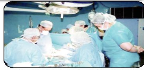
تتكفل مصلحة أمراض الكلى بالمؤسسة الاستشفائية الجامعية "أول نوفمبر 1954" لـ 250 من المرضى المستفيدين من زراعة الكلى، من ولايات غرب البلاد، الذين يقصدون ذات المستشفى للمتابعة بعد عمليات

الزوع، حسبما أفادت به رئيسة هذه الصلحة البروفيسور زردوني هابرة، وصرحت البروفيسور زردوني أن "مصلحتها تتكفل بمتابعة المرضى الذين استفادوا من عملية زراعة الكلى طوال حياتهم بعد العملية". كما أشارت إلى أن "متلقي زراعة الكلى يحتاج إلى رعاية متخصصة، مميزة بأن الهياكل الصحية التي لا تتوفر على خدمات متخصصة" لا تتكفل بهذه الفئة وبالتالي يعود هؤلاء المرضى إلى المؤسسة الاستشفائية الجامعية لهران للمراقبة وأيضاً للعلاج والاستشارة ليجتنب المشاكل الصحية. ويشارك قسم أمراض الكلى أيضاً في