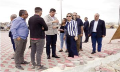
الشرقية مع مراعاة الطبع الذي تتميز به، العمل مع مكتب دراسات متخصص بالجيومات.