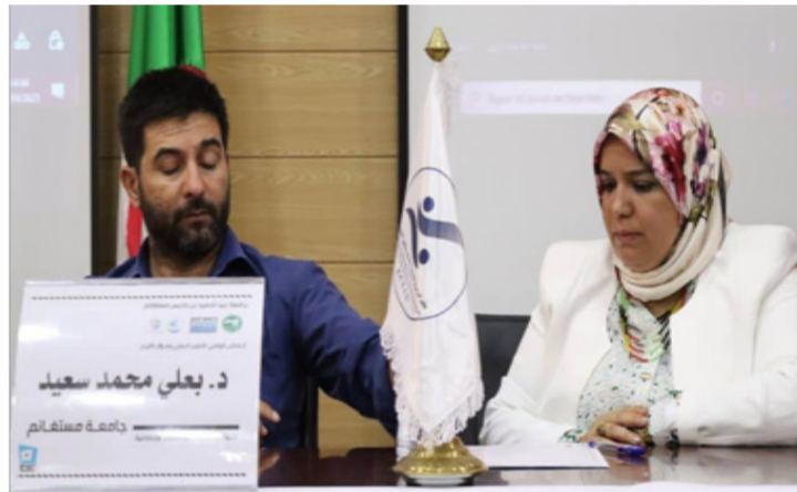
مهرجان بغداد الدولي للمسرح ؛

و تأسيس ميثاق أخلاقي و قيمي لضبط مضامين المدونات الرقمية وغيرها من الخوامل الالكترونية و الرقمية، بالإضافة إلى فرض منظومة ضريبية على الداخل من شأنه أن يعزز الرقابة على هذه المضامين و تضمن قضايا التدوين المرئي ضمن القرارات الدراسية ومشاريع التكوين الجزائري و ذلك بالاستفادة من مختلف الدراسات ذات العلاقة بالتدوين المرئي