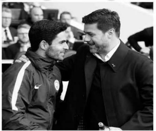
كشفت الإسباني ميكل أرتيتا مدرب أرسنال الإنجليزي أن "مثله الأعلى" ونظيره الأرجنتيني، ماوريسيو بوكيتينو، نصحه بعدم دخول معترك التدريب، وذلك عشية المواجهة المرتقبة بين تشلسي وأرسنال على ملعب ستامفورد بريدج، السبت، ضمن المرحلة

التاسعة من الدوري الإنجليزي. لعب المدرب جنباً إلى جنب في صفوف باريس سان جيرمان قبل عشرين من الزمن، وقد أشاد أرتيتا -الذي يصغر بوكيتينو بعشرة أعوام- كثيراً بالمدرب الذي لعبه الأرجنتيني في مسيرته، بالقول يوم الجمعة في مؤتمر صحافي: "كانت أول فرصة لي على الصعيد الاحترافي في صفوف باريس سان جيرمان (معازراً من برشلونة)، وقد وصل كلانا في الوقت ذاته. عشنا في القندق ذاته على مدى ثلاثة أشهر". وتابع: "هو (بوكيتينو) أحد أكثر الأشخاص تأثيراً في مسيرتي الكروية، أولاً كلاعب عندما احتضنتني. فقد اهتم بي كطفل صغير، كشقيقه الأصغر، ولعب دوراً كبيراً في نجاحي في صفوف باريس، لأنه كان دائماً يهتم بي ويسديني النصائح، وسأبقى ممتناً له دائماً، لما قام به تجاهي". كما كشف أرتيتا أيضاً بأن بوكيتينو الذي سبق له تدريب توتنهام الإنجليزي وباريس سان جيرمان، نصحه بعدم دخول معترك التدريب، وقال ضاحكاً: "نصحتني بعدم دخول مجال التدريب، إنه أمر في غاية الصعوبة". وتابع: "كنت وانسأ بأنه سيصبح مدرباً، لقد تابعته عن كثب. عندما كان لاعباً كان قائداً فعلياً على أرضية الملعب، طريقته في فهم اللعبة كانت مذهلة. لقد كان دائماً يقوم بتدريبي".