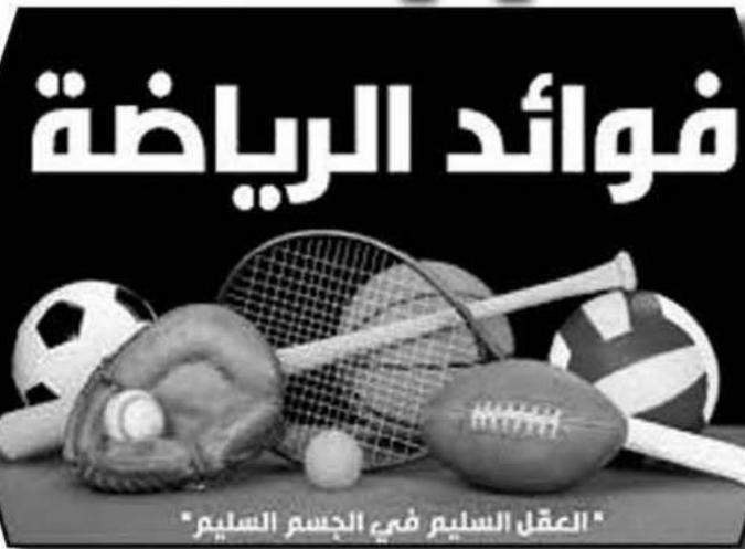
" العقل السليم في الجسم السليم "

3- أصبحت هذه الأندية تقوم بعمل استثمارات خاصة بها السياحية منها أو الفنية أو الإعلامية حيث نلاحظ أن أغلب البولات العالمية التي تقوم بها الأندية الأوروبية وخصوصا في آسيا يكون لها عوائد هائلة.