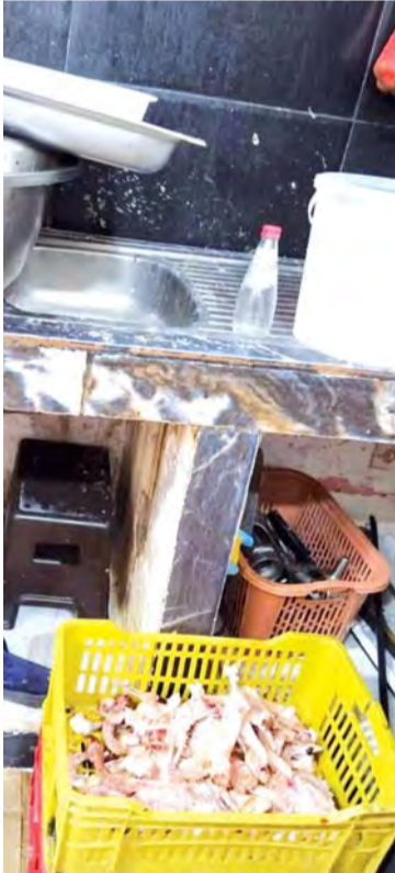
العملية العديد من القصابات.

قامت أول أمس لجنة النظافة ممثلة في مصلحة النظافة التابعة لبلدية السانية، والمفتشة البيطرية وممثل الصحة ومنظمة حماية المستهلك وعناصر الأمن بعملية مراقبة المحلات ذات الطابع الغذائي بحي قارة بلدية السانية أين تم الوقوف على عدة تجاوزات من حيث النظافة حيث تم مصادرة حوالي 21 كلغ من أنواع اللحوم غير الصالحة للاستهلاك البشري كما تم اتخاذ إجراءات إدارية فورية وردعية ضد أصحاب المحلات المخالفة ومنها الغلق الفوري، كما تم توجيه إعدارات لأخرين بذات البلدية. كما أسفرت مؤخراً عملية مراقبة نوعية للسوق الشعبي عن حجز أكثر من 25 كلغ من اللحوم البيضاء وحوالي 1.5 كلغ من أحشاء الدجاج ومست