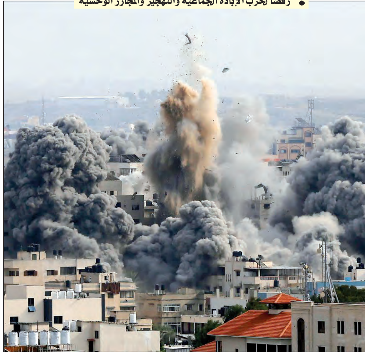
المستشفى العمداني بغزة

• رفضاً لحرب الإبادة الجماعية والتجهير والمجازر الوحشية