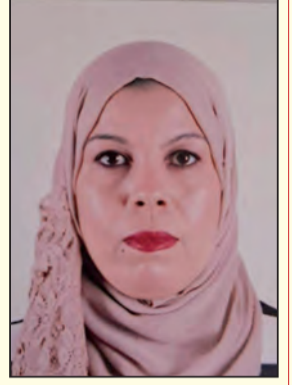
بقلم الأستاذة عبد الرحمان سلام ماستر 2 تاريخ حديث ومعاصر

تعد مظاهرات 17 أكتوبر 1961 منعطفا كبيرا في تاريخ الممارسات القمعية في تاريخ الجزائر، وهي بمثابة كشف غطاء عن تصرفات السلطات الفرنسية البوليسية إتجاه الجزائر. كما يعتبر ذلك اليوم ملحمة تعلمت منها البشرية كيف يؤتى لشعب مجاهد ان يسترجع حريته واستقلاله