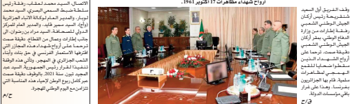
وفد الفريق أول السيد شترجيحة، دقيقة صمت ترحما على أرواح الشهداء 17 أكتوبر 1961. أوضح بيان لوزارة الدفاع الوطني، أنه بمناسبة الذكرى الثانية والسنتين لليوم الوطني للهجرة والتخليد للثورة الجزائرية الجمهورية، القائد الأعلى للثورة المسلحة، وزير الدفاع الوطني، الشرفي براهيم بلقاسم، يقف دقيقة صمت كل سنة لتخليد الذكرى، التي رحح على أرواح الشهداء، من مناسبات الذكرى 17 أكتوبر 1961.

على شهداء مجازر 17 أكتوبر 1961 وفد الفريق أول السيد شترجيحة، دقيقة صمت ترحما على أرواح الشهداء 17 أكتوبر 1961. أوضح بيان لوزارة الدفاع الوطني، أنه بمناسبة الذكرى الثانية والسنتين لليوم الوطني للهجرة والتخليد للثورة الجزائرية الجمهورية، القائد الأعلى للثورة المسلحة، وزير الدفاع الوطني، الشرفي براهيم بلقاسم، يقف دقيقة صمت كل سنة لتخليد الذكرى، التي رحح على أرواح الشهداء، من مناسبات الذكرى 17 أكتوبر 1961.