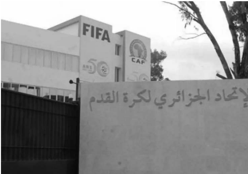
عين تموشنت : ع

قررت الاتحادية الجزائرية لكرة القدم "فاف" تقديم قروضا لأندية القسم الثاني هواة، من أجل تسديد ديونها، إتجاه اللاعبين والمدربين السابقين. ودعى رئيس "الفاف" وليد صادي، ممثلي اللاعبين والمدربين وأيضا رؤساء أندية القسم الثاني هواة. إلى اجتماع حاسم يوم الثلاثاء. من أجل النظر في قضية الديون التي حالت دون استعادة الأندية المدانة من إجازات في الموسم الجاري.