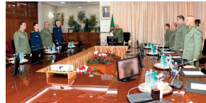
شترجيحة مسترحما على أرواح الشهداء الأبرار المحسنين شترجيحات

وقف الفريق أول السيد شترجيحة، يسير إكراه وحفا الطراد من وزارة الدفاع الوطني السيد شترجيحة، الجيش الوطني السيد شترجيحة مسترحما على أرواح الشهداء الأبرار المحسنين شترجيحات