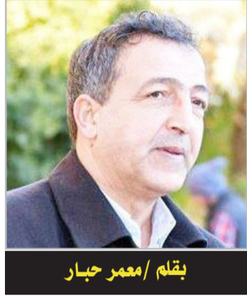
بقلم / معمر حجار

ميزات، وفضائل الصقور الفلسطينية عبر طوفان الأقصى كثيرة، ومتعددة، ومتنوعة. ومنها الشبه فيما بينها وبين الثورة الجزائرية في عظمتها، وأنها امتداد للثورة الجزائرية في عمقها، وبأساليب تطّلبها الظرف الجديد، والحصار الطويل، وخيانة بقايا العرب، ومساندة الغرب المطلق، والتطور المحفوظ وبأساليب محلية في السلاح، وطرق الكرّ والفرّ، ومنها: