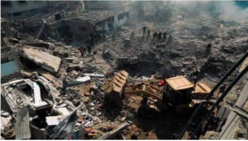
أمام، قال المتحدث باسم الجيش نحو 6 آلاف قنبلة تزن 4 آلاف الإسرائيلي إن سلاح الجو أسقط طن على قطاع غزة.

تسببت في تدمير أكثر من 17 ألف مسكن وتضرر نحو 87 ألف وحدة سكنية