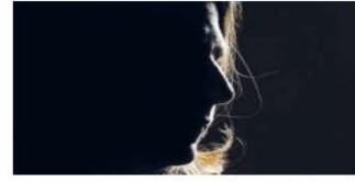
وردا على سؤال مذيع إسرائيلي إن كان عناصر المقاومة «اعتدوا عليها» قالت

المستوطنة التي قامت حماس بأسرها ثم أفرجت عنها «عاملونا بمتهنى الإنسانية» وأضافت «كانوا يحاولون تهديتنا، وإعطائنا المياه لتخفيف الضغط عنا». وأكدت المستوطنة أنه بعد الإفراج عنها، شاهدت الجنود الإسرائيليين يلقون قبيلة على البيت الذي يوجد فيه المقلومون والأسرى، وقتل الجميع من قبل قوات الاحتلال، بحسب المستوطنة.