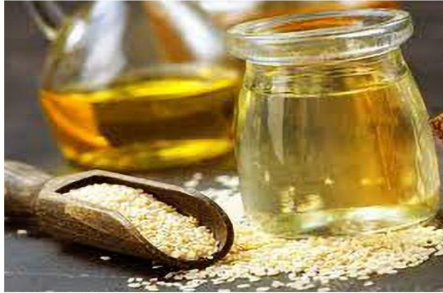
يعتبر واقيا طبيعيا للبشرة من أشعة الشمس، إذا نقد واقى الشمس، يمكن أن يكون زيت السمسم البديل الطبيعي الفعّال. يحتوي زيت السمسم على خصائص مضادة للاكسدة، مما يجعله مقيدا لحماية

يعالج التهابات ويساهم في التئام الجروح؛ يساعد زيت السمسم في تهدئة البشرة المتهيجة وتسريع عملية التئام الجروح. يعزز الدورة الدموية في البشرة ويوفر العناصر الغذائية الضرورية. بالإضافة إلى ذلك، يمكنه الحد من الندبات وتقليل مظهر الآثار الناتجة عن الجروح.