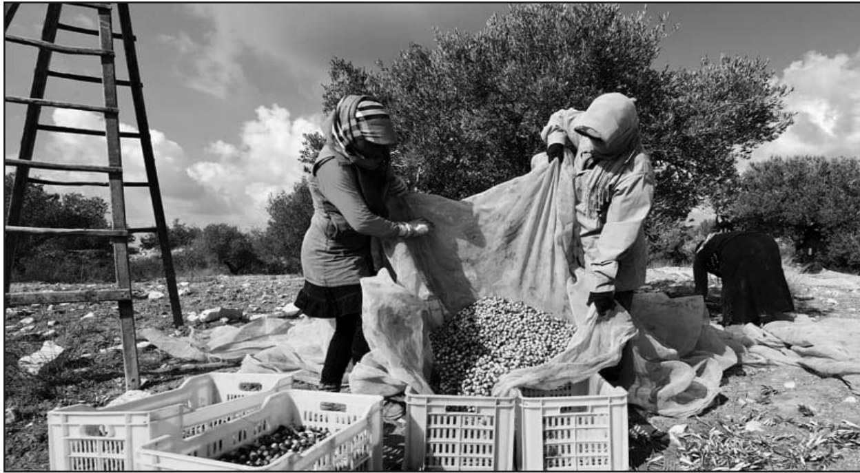
الفلاحي "وتندرج مشاركة المرأة الريفية،

وتجدر الإشارة إلى أنه قد تم على هامش هذه الدورة التكوينية التي ستواصل على مدار ثلاث أيام (17-15 أكتوبر)، تنظيم معرض خاص بالمرأة الريفية يضم مشاركات من 12 ولاية.