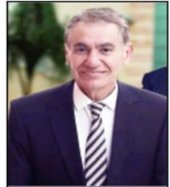
يقلم : جلال نشوان

وفي الحقيقة ، دابت حكومات الاحتلال المتعاقبة وأجهزتها الامنية الجريمة على حرمان أبناء شعبنا المقدسين من حقوقهم السياسية الوطنية والاقتصادية والاجتماعية، بهدف إفراغ العاصمة من أهلها وممارسة سياسة الطرد والتهجير والتطهير العرقي لتهويد المدينة وياقت تقول "وتتوحش عليهم في كل صغيرة وكبيرة وتعطي الضوء الأخضر لعصاباتنا من قطعان المستوطنين الإرهابيين والجماعات التلمودية والتوراتية، لكي تقارص القمع والتكثيف والإرهاب والتخويف والاعتداء على ممتلكات المقدسين ومركباتهم ولس يساعدهم الدينية الإسلامية ومسيحية من خلال القيام بممارسات شاذة وفاضحة وطقوس تلمودية وتوراتية في الأقصى ومحاولة حرق أكثر من كنيسة ودير ناهيك عن المسيرات الاستفزازية والشعارات العنصرية مثل ( الموت للعرب ) واجبل الهيكل لنا ) واطردوا العرب ) واستنجر رؤوسهم وندفنتهم أحياء، وغني عن التعريف إن هذه الممارسات القمعية والبشعة المفرقة من قمة الهرم السياسي والامني الصهيوني بحق المقدسين، والتي تسير وفق استراتيجيات مترابطة ومتلازمة تعمل من أجل تهويد المدينة وتفتيت أحيائها وإضعاف اللحمتين الوطنية والاجتماعية بين سكانها وتحويلها إلى