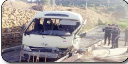
تيزي وزو) مع بلدية شعبة العمار شرق ولاية بومرداس، أدى إلى إنحراف حافلة للنقل المدرسي عن مسارها وستوقها من منحدر بعلو 5 أمتار فوق تلمبذا، مما تسبب في إصابة 29 تلميذاً كانوا على متنها. وبعد تدخل مصالح الوحدة

الثانوية للحماية المدنية ليسر، مدعومة بوحدة الشنبة لبومرداس وتيزي غثيف التابعة لولاية تيزي وزو، تم تقديم الإسعافات الأولية للجرحى ثم نقلهم إلى المؤسسة الطبية لتلقيهم إلى المؤسسة الصحية لمستشفى برج منايل، وإثر ذلك، نقلت إلى بومرداس، فورية تعامة، ووالي تيزي وزو، جيلالي دومي، إلى موقع الحادث وبعدھا إلى المؤسسة الصحية لبلدية شعبة العمار ثم إلى مستشفى برج منايل، حيث تقفدا حالة الجرحى والتقى بالطواقم الطبية التي تتكفل بهم.