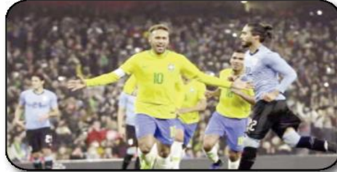
حقق المنتخب الأوروغواياني هوزيه الأخير على البرازيل يوم 1 جويلية 2001 في ملعب الألفية بمونتيفيديو ركلة جزاء بعد 33 دقيقة هدف فوز

السماوي، الذي عقد من فرص تأهل البرازيل لكأس العالم 2022، في أول مباراة للمدرب لويس فيليبسي سكولاري، الذي توج بعد عام بالتتمة والكمال من تلك المباراة، في 30 جوان 2002، بلقب المونديال مع السامبا. القريب أنه حتى تلك المباراة كان يمكن أن تنتهي بالتعادل، بعد أن سجل ريفالدو هدفاً قبل النهاية بـ5 دقائق، حيث أمسك حارس المرمى فابيان كاريني الكرة من داخل شبكها، لكن قرار الحكم هوغو دالاس كان إلغاء الهدف، مما حرم السيليساو من التعادل.