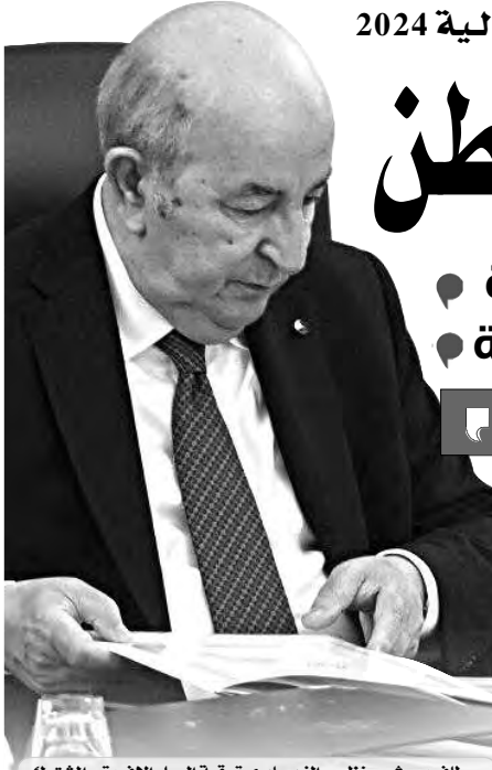
عطاف يبحث مع نظيره الزيمبابوي ترقية العمل الإفريقي المشترك

ذكر بيان اجتماع مجلس الوزراء الذي ترأسه السيد عبد المجيد تبون رئيس الجمهورية القائد الأعلى للقوات المسلحة وزير الدفاع الوطني، أمس، وتم افتتاح أشغاله بإستعراض حصة نشاط الحكومة خلال الأسبوعين الأخيرين، بأن السيد الرئيس أسدى لأعضاء الحكومة جملة من التوجيهات والأوامر ذات الصلة بالمفائل التي تم تناولها الاجتماع، والتي شملت إلى جانب مشروع قانون المالية لسنة 2024، قطاعات الداخلية، التعليم العالي، الفلاحة، البريد والمواصلات والأشغال العمومية. فيخصوص مشروع قانون المالية 2024، أمر الرئيس تبون بتخصيص مجلس وزراء خاص لدراسة ومناقشة هذا النض بالدقة اللازمة، مشددا في سياق متصل، على ضرورة أن يتضمن المشروع عند عرضه للدراسة كل القرارات التي تم اتخاذها في اجتماعات مجلس الوزراء، سواء في الجانب الاجتماعي أو الاقتصادي، وكذا الحفاظ على سيادة البلاد بعدم اللجوء إلى الاستدانة. كما أكد السيد الرئيس على أولوية تنفيذ المشاريع ذات البعد الاستراتيجي لتحريك اقتصاد البلاد، مع مراعاة التقلبات التي يشهدها العالم في هذه الظروف، لمحا على