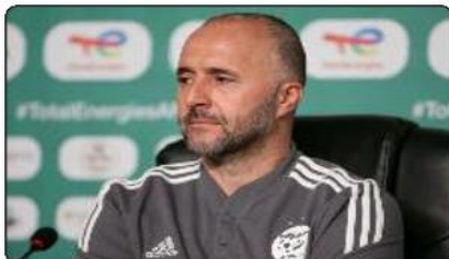
تلقى مصر والجزائر ودينا مساء بعد غد الاثنين، على ملعب هزاع بن زايد في الإمارات، ضمن استعدادات المنتخبين لتصفيات مونديال 2026.