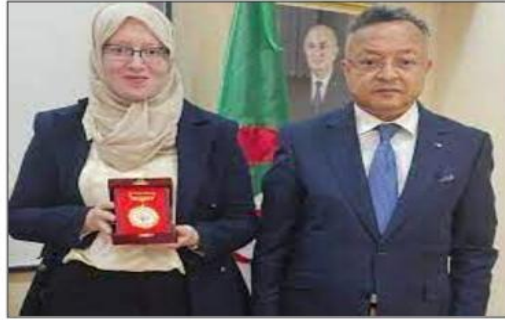
لشبهون بالجامعات الجزائرية وتطويرها وترقيتها لصف الجامعات الدولية.

كرم وزير التعليم العالي والبحث العلمي، كمال بداري، 23 مدير مؤسسة جامعية، تكريماً لهم، نظير تواجد جامعاتهم ضمن تصنيف «التايمز»، في طبعة 2024.