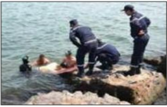
أسفرت حصيلة تدخلات مصالح الحماية المدنية لولاية وهران خلال موسم الاصطياف عن وفاة 19 شخص غرقا

عرض بالشواطئ غير مسجونة للسباحة وكذا خارج أوقات الحراسة. كشفت الأقسام المستفدة من المديرية الولائية للحماية المدنية بولاية وهران عن تسجيل 19 غرقا تراوح أعمارهم ما بين 12 و 61 سنة من بينهم 11 حالة غرق سجلت على مستوى مناطق صخرية بشواطئ مجموعة السباحة و 05 غرقا على مستوى شواطئ مسجونة للسباحة أين كان البحر هائج ومضطرب والسباحة بمجموعة و 03 غرقا في تمجيدهم خارج أوقات الحراسة الخاصة بأعوان الحماية المدنية كما تمكن أعوان الحماية من إنقاذ 1669 شخص من الغرق في حين تم إسعاف 1716 شخص في عين المكان وذلك عبر 32 شاطئ مسجونة للسباحة وكشفت حصيلة التدخلات عن تسجيل 280 شخص في مختلف المراكز الصحية القريبة من مختلف الشواطئ المسجونة للسباحة. كما سجلت ذات المصالح 3708 تدخل أعوان الحماية المدنية طيلة موسم الاصطياف. والجدير بالذكر فإن الجزائر سجلت خلال موسم الاصطياف ارتفاع كبير وخطير لحالات الغرق عبر الشواطئ والمساحات المائية وكذا السدود حيث سجلت أنقل حصيلة عبر شواطئ ولايات مستغابم وهران وبجاية الأمور قد أرجعت مصالح الحماية المدنية أسباب ذلك إلى السباحة في الشواطئ الممنوعة خارج أوقات الحراسة بالشواطئ المسجونة بها السباحة وعدم التقيد بمعايير السلامة والوقاية. عالية. س.