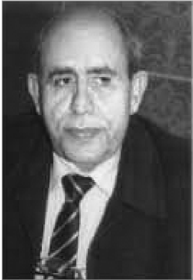
الدكتور عز الدين المناصرة (شاعر، وناقد، ومفكر فلسطيني)

يجد الباحث في تاريخ توظيف الشعر العربي للشهادة والشهيد نفسه يقرأ الكثير من النصوص، من صدر الإسلام إلى اليوم، وهو ما فتح الدراسات النقدية على تجليات التوظيف ومستوياته الفنية والفكرية، بالإضافة إلى البحث في ملامح الشهيد والخصائص الدلالية لفعل الشهادة. وهذه وقفة عند صورة ودلالات الشهيد عند الشاعر الفلسطيني عز الدين المناصرة.