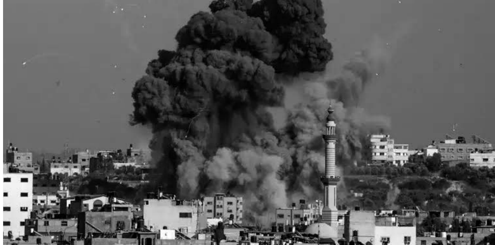
التهجير القسري للشعب الفلسطيني الشقيق

حذّر أعضاء البرلمان العربي من خطورة تطورات الأوضاع في فلسطين والانتهاكات المنهجية التي تقوم بها إسرائيل "القوة القائمة بالاحتلال" وتماديها في قيامها بشن حرب إبادة مفتوحة تقوم خلالها بقصف همجي للأحياء والمدن واستهداف متعمد للمدنيين في قطاع غزة وتدمير البنية التحتية، ما أسفر عن سقوط الآلاف من الشهداء والآلاف الجرحى بينهم عدد كبير من الشيوخ والنساء والأطفال الأبرياء.