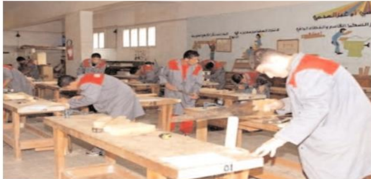
التقنيدي بالولاية للجمعية الوطنية للشباب الجزائري إضافة إلى توقيع اتفاقيات بين مركز التكوين المهني والتمهين "الشهيد بن الشحم محمد" ببلدية حاسي الفحل (155 كلم شمال الولاية) وبعض الجمعيات الفاعلة في مختلف المجالات، وفق نفس المصدر.

أبرمت مديريةية التكوين والتعليم المهنيين لولاية المتنوعة مجموعة من الاتفاقيات مع مختلف المتعاملين الاقتصاديين والاجتماعيين وذلك بمناسبة الدخول التكويني الجديد (دورة أكتوبر 2023)، حسبما علم لدى القائمين على القطاع بالولاية.