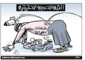
القبعة العربية الحقيقية... باني