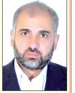
بقلم د. مصطفى يوسف الداوي

لم تكن تصريحات وزيرة الخارجية الألمانية حول الحرب الوحشية التي يشنها جيش الاحتلال الإسرائيلي على الشعب الفلسطيني في قطاع غزة مفاجئة لنا، أو صادمة لمشاعرنا، أو مخالفة لتوقعاتنا.