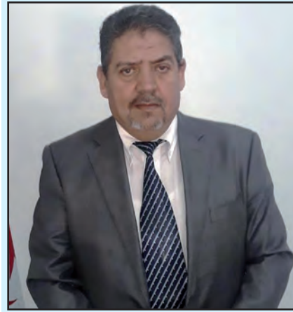
جلب الاستثمار الأجنبي

الزيادة ستمنع حدوث تقلبات حادة في قيمة الدينار فعالية كبيرة للجزائر في الأسواق الخارجية