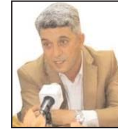
■ بقلم: فارس الحباشة

«ملك ملوك» اسرائيل نتنياهو سارع في طلب العون والاعانة العسكرية والاقتصادية من واشنطن. فأين هي اسرائيل القوية والمنيعه، واين اسطورة الدولة المتفوقة امام رشات صواريخ لفصائل المقاومة، واقل من الف مقاتل احتلوا 7 مستوطنات، وحطموا ومحو اسوار المستوطنات الدينية في الخيال والذهنية اليهودية التلمودية؟ وماذا تقول اسرائيل لاصدقائها وحلفائها في الاقليم؟ وما تقول لدول عربية تجرأ طوعا وقسرا الى التطبيع؟ واي مصير قد يواجه مسارات التطبيع العربي مع اسرائيل؟ وماذا يحمل قادم الايام من مفاجات في الاقليم الضانج. يوم السبت العظيم.. اسقط القناع، واسقط عورة اسرائيل ومن يسير في ركبتها ومجالها. وبعد 3 ايام على اندلاع معركة «طوفان الأقصى» الهلع هو متلازمة اسرائيلية