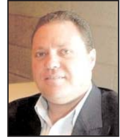
■ بقلم: سري القدوة

أحرار العالم مطالبين بالخروج عن حالة الصمت والإعلان عن اوسع حملة للتضامن مع الشعب الفلسطيني في أوروبا واستنكار سياسة المعايير الازدواجية التي تعزز قوة الاحتلال الاستعماري الإسرائيلي في الأرض الفلسطينية، ولا بد من دول العالم والشعوب التي تؤيد حق تقرير مصير الشعب الفلسطيني ان تعمل بكل قوة ضمن موقفها الثابتة حيال دعم الشعب الفلسطيني في تحقيق تطلعاته ونيل حقوقه المشروعة كاملة وإقامة دولته المستقلة وعاصمتها القدس الشرقية. لا بد من ووقوف أصحاب الضمائر الحية إلى لجانب الشعب الفلسطيني وحقوقه المشروعة والتصدي بحزم للعمليات