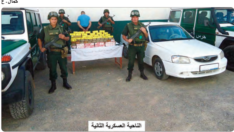
التاحية العسكرية الثانية

تتمتت مفارز مشتركة للجيش الوطني الشعبي، في عمليات متفرقة، خلال أسبوع، من إحباط محاولات إدخال مزيد من 9 قناتير من الكيف المعالج عبر الحدود مع المغرب وتوقيف 58 تاجر مخدرات.