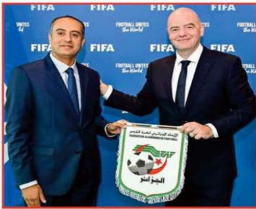
صادي يلتقي رئيس الفيفا