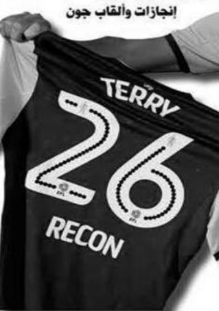
إنجازات وألقاب جون

حيث كان مسدداً دائماً للخطورة في ألعاب الهواء وقد سجل 41 هدفاً وهو رقم لم يحققه أي مدافع في تاريخ الدوري الإنجليزي. شهد موسم 2016/2017 اعتزال هذا الأسطورة وواحد من أفضل المدافعين في تاريخ الدوري الإنجليزي. تعرض تيري للعديد من الإصابات المتكررة التي أخرجه من تشكيلة انطونيو كونتي ولكن على الرغم من مشاكله البدنية الكبيرة، إلا أنها لم تمنعه من دعم زملائه وأن يستمر في تجميعهم حتى وهو خارج المستطيل الأخضر. أعجب كونتي كثيراً بقدراته الفنية والقيادية وقام بتوجيهه بأفضل طريقة على الإطلاق بعد أن قام بإخراجهم من الملعب في الدقيقة 26 نسبة لكونه يرتدي الرقم 26 وقام اللاعبون داخل الملعب حينها بالإستطاف له وعلواً ممر شرفي تخليداً لهذه الأسطورة الكبيرة في آخر لحظاته داخل المستطيل الأخضر. انتقل تيري بعدها للعب لمدة موسم مع أستون فيلا في بطولة التشارمبيونشيب ومن ثم انضم إلى الجهاز الفني للفريق وكان بدون شك واحد من أبرز المساهمين في صعود النادي مرة أخرى للدوري الإنجليزي الممتاز ابتداءً من موسم 2019/2020 بفضل قدراته القيادية المميزة.