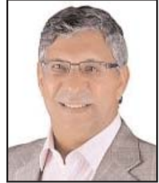
■ بقلم: إبراهيم نوار