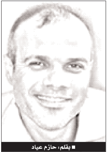
■ بقلم: حازم عياد

من أنتم يا رجال المقاومة حتى ترعبوا الصَّهانية وتزعجهم في صباح باكر، في يوم عيدهم وعطلتهم، وهم نيام مطمئنون على سلامتهم، مرتاحون آمنون في سريهم الذي أخذوه بقوَّة القانون؟ من أنتم يا رجال الرِّجف الطوفاني حتى تكتسحوا مناطق المستوطنين وهم يتباهون باستيلائهم على أراضٍ لا يتمكَّن