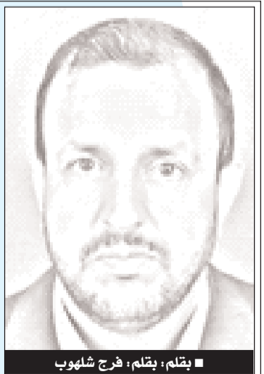
■ بقلم: بقلم: فروح شلهوب

الاستيطاني الإسرائيلي المنتشر في البلدات والقري المدن الفلسطينية المحتلة. غير أن الاحتلال من ناحية عملية لا زال عاجزاً عن وقف الهجمات والاختراقات البرية والبرية الفلسطينية، كما انه يعاني من تحديد مصادر التهديد والخطر بدقة برا وبحر وجوا من الشمال الفلسطيني إلى الجنوب والوسط في الضفة الغربية، فالمعركة تدور على مساحة فلسطين التي لا تتجاوز 27 كم مربع تمتد على شريط ساحلي 240 كم ويعمق يتراوح بين 48 و120