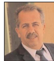
■ بقلم: إبراهيم نوار

وزير حرب هذا الكيان المحتل غالات الذي هدد قبل أقل من شهرين بإعادة لبنان إلى العصر الحجري ومسؤوليته في التدخل بضربات على سوريا مع ان ليس هناك اي محاولة اعتداء او تسلل من داخل الاراضي السورية وضربات متواصلة على غزة وحماية مستوطنين يدخلون بشكل سافر الى المسجد الأقصى، والاعتداء على جنين