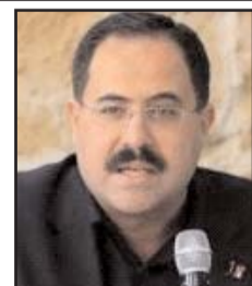
■ بقلم: صبري صيدم

لقد جريتم الحروب من قبل، ببشاعاتها وكوارثها ومصائبها، فهل قادت إلى الحلول؟ أم أسست للمزيد المزيد من الحروب؟ لقد