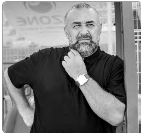
يعيش وبن شيخخة فضلا الانسحاب بشرف

وعلى عكس المدربين الأجانب، الذين يحسون أنفسهم بمعقود من "الاسمنت المسلح"، ويلوون بورقة "الفيفا" لتبيل حقوقهم، فإن المدربين الجزائريين، أو الأخرى المحليين، هم في الغالب الضحية المفضلة لرؤساء الأندية الجزائرية، حيث يجري التخلي عنهم بسهولة كبيرة، ودون أي تعويضات تذكر، بناء على المعقود غير المحصنة، التي وقعوها في فترة سابقة، أو بسبب الخطاب العاطفي في أغلب الأحيان، الذي يوجه لهم لإقناعهم بالتنازل عن بعض مستحقاتهم، بعكس ما يحدث مع المدربين الأجانب.