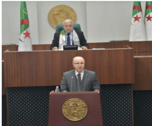
إيجابيا هذه السنة ليستقر عند حدود 11.3 مليار دولار كفاض.