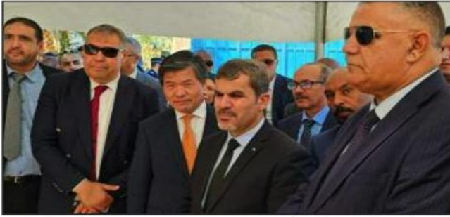
الحري والمنتجات الصيدية بنفس المزرعة على مراسم إهداء اتفاقية بين المركز الوطني للبحوث والتربية في الصيد البحري وتربية المائيات وشركة «قلوبال فري فود» التي هي فرع من مؤسسة جديدة لتربية البلطي والجمبري وأعراف الأسماك.

أكد وزير الصيد البحري والمنتجات الصيدية أحمد بداني أن أسماك المياه العذبة في الجزائر لم يعد حلما بل أصبح واقعا ملموسا. بورقلة أن هذه الولاية تعد "نموذجية" في مجال تربية المائيات.