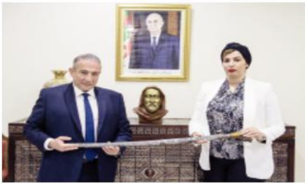
لتوجيهات رئيس الجمهورية، السيد عبد المجيد تبون، القاضية بشروية تعزيز حماية التراث الثقافي الوطني وسون الذاكرة الوطنية الموجودة بالخارج، حسب البيان.

الجماعية والسهر على استرجاع الممتلكات الثقافية المتواجدة في الخارج، بغية حفظها وتأمينها ويبلغ طول هذا السيف الأثري 107 سم وهو مصنوع من مادة الفضة، وبه زخرف خشبي مغطين بالفضة مزخرفة بلخفاف أوراق الشجر ومزود بسوار يحلقين معلقين بسلسلة وهو مؤرخ في الفترة الممتدة ما بين 1808 إلى 1883. وسيتم حفظ هذا السيف والوثائق المرتبطة معه ضمن المجموعات المتحفية الوطنية لينظم لها في المتحف الأثري والفنية التي تم استرجاعها مؤخرا بفضل التنسيق الحكيم بين مصالح وزارة الثقافة والفنون ومختلف الممثلات الدبلوماسية الجزائرية في الخارج.