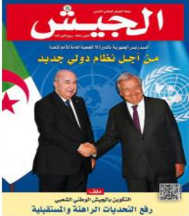
العدد 199 الصادر في 23 ربيع الأول 1445 هـ

قالت مجلة الجيش في عددها الأخير، إن ترسيم تاريخ 8 أكتوبر من كل سنة "يوما وطنيا للدبلوماسية" جاء عرفانا للجهود المضنية التي بذلتها دبلوماسيتنا منذ ثورتنا التحريرية المظفرة. وتتمينا لرصيدها النضالي وتجربتها الثرية وكذا بالنظر إلى مواقف بلادنا المشرفة إزاء مختلف القضايا الإقليمية والدولية.