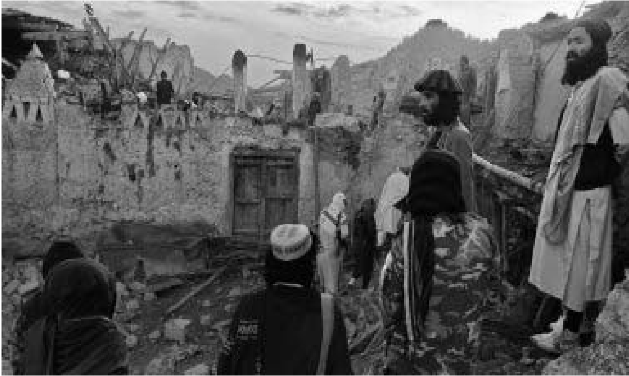
(06:30 بتوقيت غرينتش). وقال المتحدث باسم خدمات

وتتعرض أفغانستان بشكل متكرر للزلازل، خاصة في سلسلة جبال هندو كوش، بالقرب من مكان التقاء الصفائح التكتونية الأوراسية والهندية.