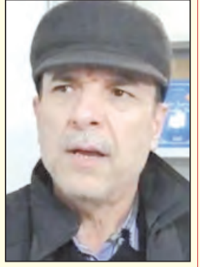
د. عبد الحق مواقف

بعد قرابة القرن من مقارعة الاستعمار الفرنسي بكل الأساليب، أدركت الحركة الوطنية الجزائرية أن الصراع مع فرنسا يجب أن يأخذ منحى آخر. وبعد مخاض عسير ولدت اتجاهات أساسية ثلاث هي الاتجاه الاستقلالي والاندماجي، والإصلاحي، هذا الأخير الذي برز فيه الشيخ عبد الحميد بن باديس كرائد من رواده باتت فرنسا تحسب له ألف حساب. وكان نادي الترقى النواة الأولى التي انطلقت منها شرارة الإصلاح، لتكتمل العملية بميلاد جمعية العلماء يوم 5 ماي 1931م وفرنسا تحتل بالذكري المنوية لاحتلالها الجزائر.