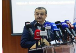
المداحيل، ولت الوزير عرقاب إلى ان ازدياد الطلب العالي على المعادن والمنتجات المتعلقة بها في العديد من المجالات الصناعية حد من

أكد وزير الطاقة والمناجم السيد محمد عرقاب خلال ترأسه اشغال ندوة وطنية حول موضوع «ندرة الموارد الطبيعية وتوقع الجزائر: دور ممكن الزئك والرماس تالة حمزة - أميرزو» بالقطب الجامعي «أبودو» بجامة عبد الرحمان مبردة بجاية جمعت صغدا من الوزراء والخمسين أن الدولة تولى اهتماما كبيرا لهذا المشروع وقد وضعت من أجل هذا البات واصلاحات رامية إلى تشجيع البحث والاستغلال وترقية المؤسسات المرتبطة بالصناعة المنجمية من أجل