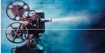
والحفاظ على الهوية ليتناول الفصل السابع والأخير مدخل لقراءة السينما للأحداث.

السينمائي والتصوري في إنجاز البرامح السمعية البصرية وأسس بنا سينماريو الفيلم الوثائقي والفرق بينه وبين التحقيق الصحفي بينما خصص الفصل الرابع لمفهوم الحصة الخاصة وتقاطعها مع الفيلم الوثائقي. كما يسلط الفصل الخامس الضوء على اللغة السينمائية بينما تضمن الفصل السادس نظريات الفيلم والإخراج مع نموذج تحليل فيلم وثائقي ودور الفيلم الوثائقي في ترقية فعل المواطنة