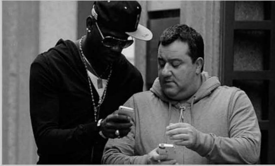
للحصول على رخصة مزولة مهنة "وكيل لاعبين".

كم تدفع الأندية الإنجليزية لوكلاء اللاعبين؟ نشر الاتحاد الإنجليزي تفاصيل عن المبالغ التي دفعتها أندية الدوري الإنجليزي الممتاز لوكلاء اللاعبين. وقد صنعت القائمة مجموعة من الأرقام المذهلة. ماذا حدث؟ توقفت نفقات الأندية الإنجليزية على بقية أندية أوروبا خلال آخر فترتي انتقالات، وبفارق كبير. لكن دور وكلاء اللاعبين كعنصر في سوق الانتقالات هو أمر لا يحظى بالكثير من الاهتمام. ومع ذلك تغير الوضع اليوم مع نشر الأرقام الجديدة، التي توضح المبالغ التي دفعتها أندية الدوري الإنجليزي الممتاز لوكلاء اللاعبين منذ فبراير/شباط عام 2022. ولم يحتل نادي تشيلسي قمة القائمة، رغم إنفاق "البلوز" مبالغ ضخمة خلال آخر فترتي الانتقالات. بينما كان مانشستر سيتي هو النادي الأكثر إنفاقاً على رسوم الوكلاء في العام الماضي.