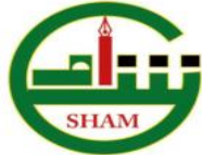
منبر أدباء بلاد الشام

للدمع! بقلم: جورج عازر . X منبر أدباء بلاد الشام (السويد) - إقليم شمال أوروبا .