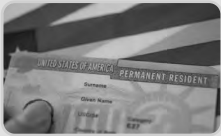
الولايات المتحدة الأمريكية، والمعروفة أيضاً باسم قرعة التأشيرة أو برنامج تأشيرة الهجرة

يسعى العديد من المواطنين حول العالم للدخول عبر موقع الهجرة العشوائية لأمريكا 2023 لمعرفة موعد وإجراءات التسجيل في الهجرة العشوائية لأمريكا، والمعروفة أيضاً باسم قرعة التأشيرة أو برنامج تأشيرة الهجرة واللوتري الأمريكي هو برنامج سنوي تقدمه الحكومة الأمريكية للأشخاص من جميع أنحاء العالم للحصول على تأشيرة هجرة دائمة إلى الولايات المتحدة، ومن المقرر أن يتم التقديم للوتري عبر موقع الهجرة العشوائية لأمريكا من خلال الموقع الإلكتروني للحكومة الأمريكية. يجب تقديم الطلب خلال فترة التقديم، والتي تبدأ في أكتوبر من كل عام وتنتهي في نوفمبر من نفس العام، كما سيتم الإعلان عن نتيجة الهجرة العشوائية لأمريكا، بعد التسجيل على موقع الهجرة العشوائية إذا تم اختيار المتقدم، وسوف يتلقى رسالة إلكترونية تتضمن رقم التأكد الخاص به. وتحتاج عملية التقديم على الهجرة العشوائية لأمريكا 2023 لمجموعة من المستندات والأوراق، كما هو موضح في موقع الهجرة العشوائية لأمريكا، كما يمكن زيارة الرابط التالي للتقدم للهجرة العشوائية لأمريكا في قسم إجراءات تأشيرات الهجرة المتعددة، كذلك يمكن التحقق من وضع طلب تأشيرة الهجرة العشوائية لأمريكا، وبيئ الاستعلام عن نتائج القرعة الأمريكية (اللوتري) مفتوحاً حتى يوم 30 سبتمبر من 2024 على موقع الهجرة العشوائية.