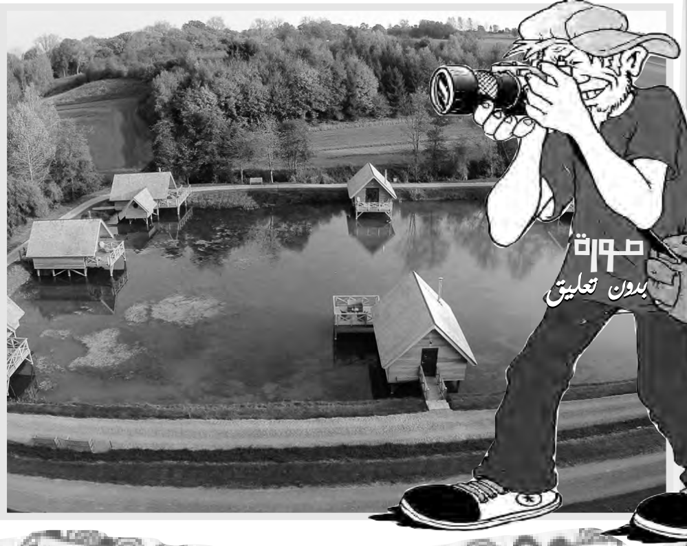
صورة بدون تعليق

ذكرت صحيفة "تيلغراف" أنه من المقرر أنه يعلن وزير الصحة البريطاني ستيف باركلي، منع النساء المتحولات من دخول أجنحة المستشفيات النسائية، وقالت الصحيفة البريطانية أنه بموجب قرار الوزير، سيتم منع النساء المتحولات (الرجال البيولوجيين) من دخول أجنحة المستشفيات النسائية بموجب خطط وزير الصحة لاستعادة "القطرة السليمة" إلى هيئة الخدمات الصحية الوطنية، وذلك استجابة للقلق المتزايد في الخدمة الصحية الذي أدى إلى تهيش حقوق المرأة بشكل متزايد. وستمنع التغييرات الرجال والنساء الحق في الحصول على الرعاية في أجنحة يتقاسمها فقط أشخاص من جنسهم البيولوجي، والحصول على رعاية خدمات الرعاية الحميمية (مثل المساعدة على الاستحمام) من قبل الأشخاص من نفس الجنس، وقال باركلي إن الخطة ستعيد عودة "نهج المنطق السليم تجاه الجنس والمساواة"، مما يضمن حماية كرامة المرأة وسامع أصواتها، وسيعمل باركلي أيضاً عن عودة اللغة "المخصصة للجنس" إلى هيئة الخدمات الصحية الوطنية بعد حذف الأشارات إلى النساء من النصوص المتعلقة بانقطاع الطمث وأمراض مثل سرطان عنق الرحم والمبيض، وتأتي هذه المقترحات في أعقاب مخاوف المرضى والموظفين بشأن السماح للرجال البيولوجيين بالدخول إلى أجنحة مستشفى النساء.