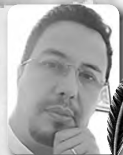
بقلم: حسان زهار