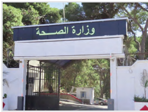
لفائدة جميع المكلفين بالمؤسسات الصحية. فضيلة ح

وأوضحت وزارة الصحة، أنه وفي إطار تنفيذ المخطط الوطني القطاعي للتكوين وتحسين القدرات لسنة 2023، وتنفيذا لاتفاقيات التعاون والتبادل الممضاة بين المدرسة الوطنية للمناجمنت وإدارة الصحة ومدارس ومعاهد الدراسات العليا الأجنبية المختصة، وإدارة الصحة تحت إشراف مديرية التكوين لوزارة الصحة، دورة تكوينية حول "الاتصال داخل المؤسسة الصحية" لفائدة المكلفين بالاتصال على مستوى مديريات الصحة والسكان عبر مختلف ولايات الوطن.