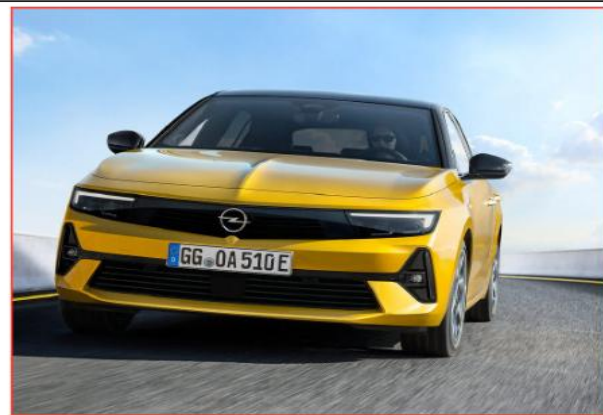
تشمل هذه التحف سيارات العرض الأولية مثل النسخة طبق الأصل الدقيقة لسيارة أوبل «Kadett» للعام 1938 ذات المقعدين، والتي تم تطويرها في ذلك الوقت تحت الاسم الرمزي «Strolch» ويمكن اعتبارها السيارة الرائدة التي استلهمت منها جميع طرازات كاديث وأسترا

والى جانب سيارات الرالي، طرحت الشركة مجموعة من أوائل سيارات تورينغ الرابحة التي قدمت أعلى مستويات الأداء، منها أساطير السباق مثل Opel Rekord Ka dett»GSi و «Black Widow C» و «16V DTM»، التي أثارت إعجاب الجماهير في حلبات السباق منذ عام 1989.