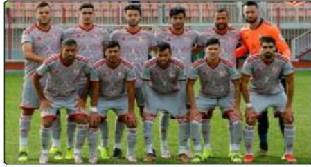
هذا الفوز مستحقا باعتبار أن السادي الجزائري كان متفوقا بكثير على فريق لم

يكن لديه القدرة على التنافس والذي كان شباب بلوزداد قد أقصاه الموسم الماضي في نفس المنافسة. وانظر جماهير فريق الري الأحمر والأبيض حتى الدقيقة الـ 78 ليهتز شاك الحارس أبو كومو من ركلة جزاء. وقد أصححت مجريات الشوط الثاني من المباراة في اتجاه واحد، مع سيطرة كبيرة لشباب بلوزداد الذي عاد بنفس العزيمة وسجل الهدف الثاني عن طريق قبل أن يعقم نفس اللاعب الفارق بهدف ثالث في اللحظات الأخيرة من المقابلة. وقد أظهر شباب بلوزداد قدراته الفنية وتجربته في مثل هذه المنافسات القارية من خلال تسيره للمباراة كما ينبغي.