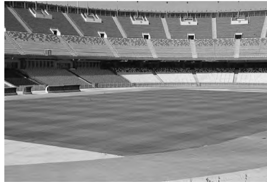
مسابقة دوري أبطال إفريقيا لكرة القدم