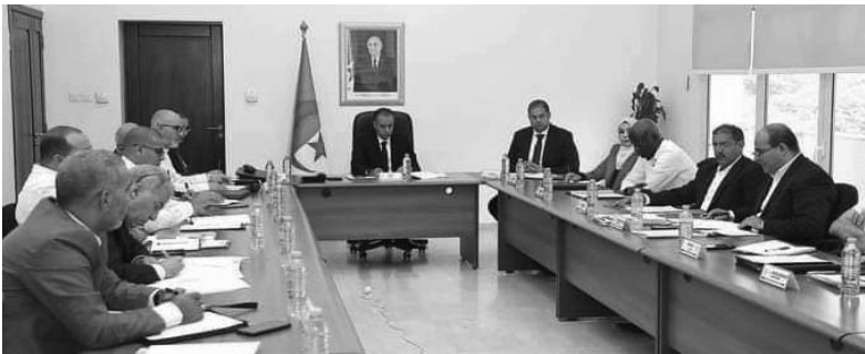
رابطة أبطال إفريقيا: