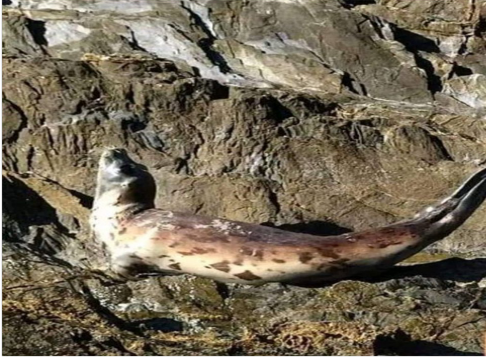
ظهور الفقمة بشواطئ جيجل